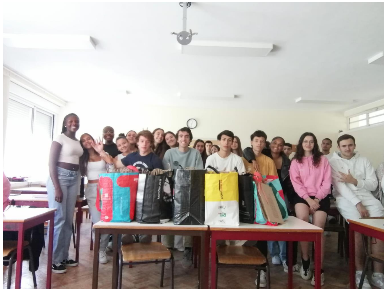
Foto do Grupo no dia da primeira entrega dos livros na Farmácia